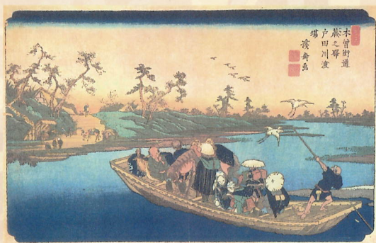
木曾街道 蕨之驛(写)