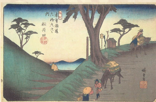
木曾海道六拾九次 松井田(写)