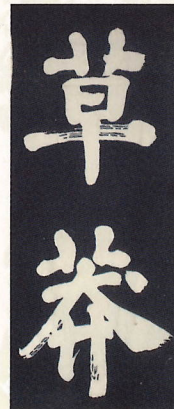
草莽(そうもう) 在野の人