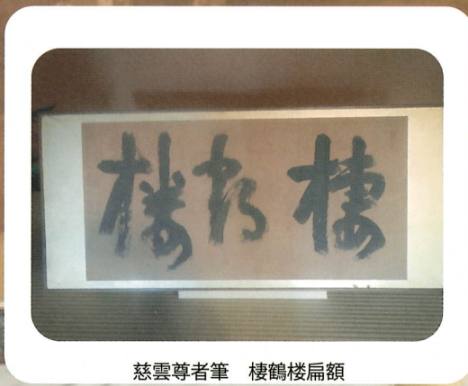
慈雲尊者筆 棲鶴楼扁額