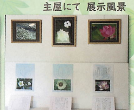
主屋にて 展示風景

奈良県で活動している「奈良花写真の会」の写真展示。四季折々の野の花や植物の一瞬一瞬を捉えた美しい万葉の花写真をお楽しみください。協力: 奈良花写真の会