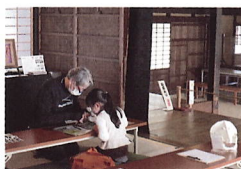
旧河澄家主屋にて「立体切紙キリッタイをつくろう!」ワークショップ風景