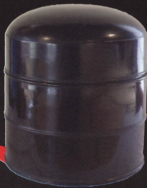
化粧道具入れ/旧河澄家蔵