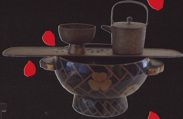
お歯黒道具/旧河澄家蔵

毒にも薬にもなる日本の化粧の歴史を紐解きながら 河澄家に伝わる化粧道具や調度を展示します