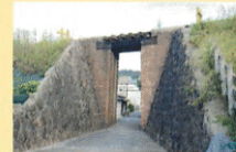
明治のレンガ造り橋台