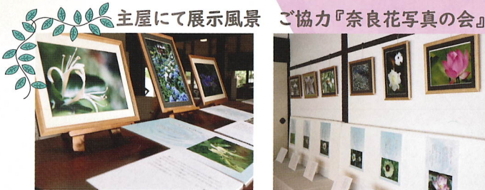
主屋にて展示風景 ご協力『奈良花写真の会』

『万葉の花』(青幻舎)の著者片岡寧豊氏が万葉集に詠まれた植物と歌をわかりやすく紹介。解説入りパネルは片岡寧豊氏の写真と文によるものですが、同時に『奈良花写真の会』の皆様の写真展示も楽しめます。自然と共に生きた万葉びとの心に触れ、野辺の花の魅力に触れてみませんか。