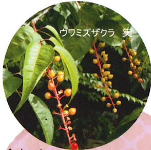
ウツミズザクラ 実