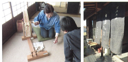
河内木綿の伝統を守り、綿の栽培から糸を紡ぎ、機を織りすべて手作業にて商品を製作・販売。各種体験もしています。 協力：河内木綿はたおり工房

お申込みは、 2021年11月2日(火) 9時30分より受付開始 電話またはHPお問合せフォームより