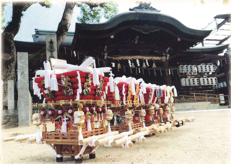
ミニチュア布団太鼓 (大宮顕秀氏 作)