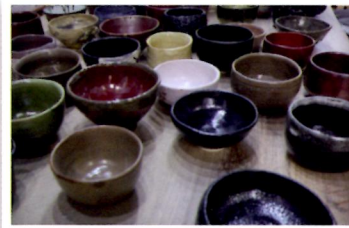
石切工房・桜陶庵 生徒のみなさまの作品