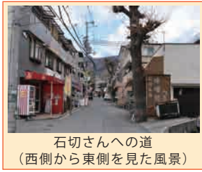
石切さんへの道 (西側から東側を見た風景)