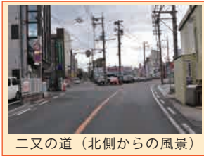
二又の道 (北側からの風景)