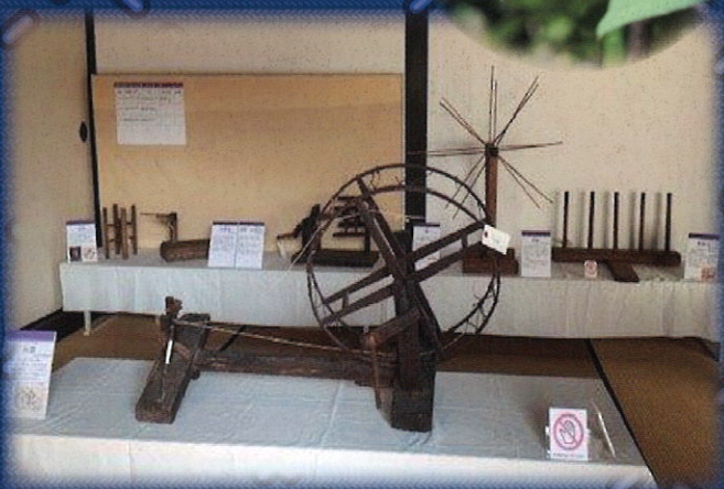
2018年 河内木綿展の様子