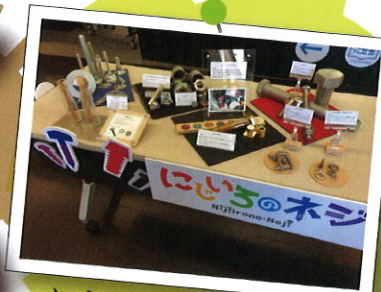
にじいろのネジ展示