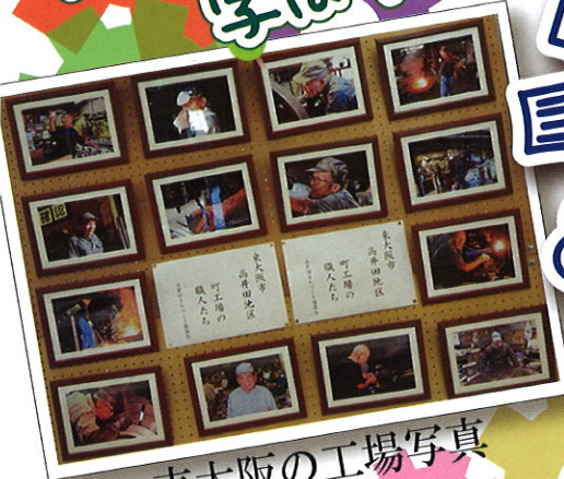
東大阪の工場写真