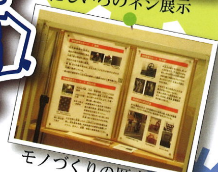
モノづくりの歴史展示