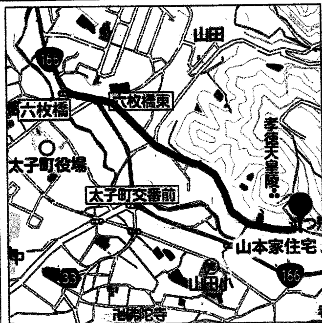
③ 大道旧山本家住宅 (国登録有形文化財)