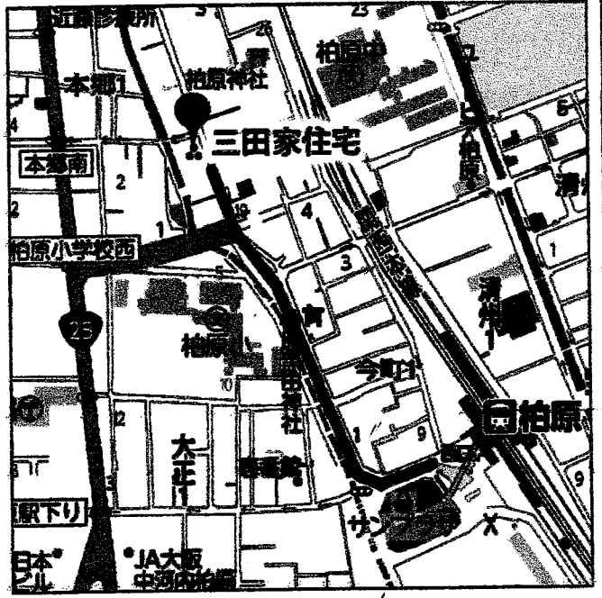
② 三田家住宅 (国重要文化財)